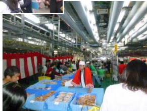
（昨年度の感謝祭から）